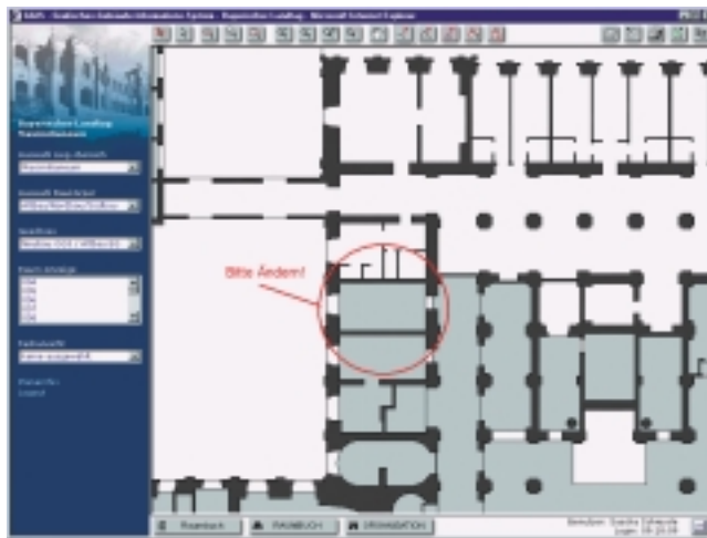
Bild 7: Grafisches Gebäudeinformationssystem im Bayerischen Landtag

Die Gebäudegliederung selbst wird in der zentralen Datenhaltung gepflegt, d.h. hier werden Räume angelegt, gelöscht oder verschoben.