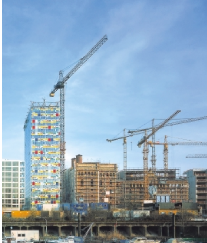
Bild 8: Bei der gigantischen Datenmenge eines mittlereren bis großen Bauvorhabens werden spezielle Tools für die Qualitätskontrolle eingesetzt

Für die Erstellung des eigentlichen Raumbuches mit Verknüpfung zu Nutzungs- und Anlagenstrukturen reicht Excel allerdings nicht aus. Hier werden Erfassungswerkzeuge benötigt, die die Anwendungslogik von FM-Systemen beherrschen. Auch ist die Möglichkeit gefordert, Replikationen (Kopien) der Masterdatenbank zu erzeugen und die Teil-