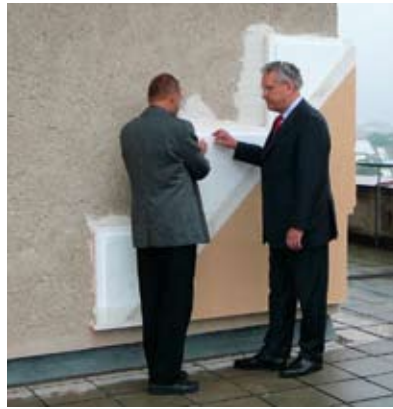
Innenminister Herrmann informiert sich über die Arbeiten

vorschläge mit allen geplanten Maßnahmen für die von ihnen betreuten Gebäude ergänzen. Aus U-Werten, Flächenangaben, Energieträgern, Kosten und zusätzlichen Angaben wird die CO 2 -Effizienz der Maßnahmen ermittelt. In den ausführenden Abteilungen ist für die Dateneingabe keine Softwareinstallation nötig, da für das Projekt eine speziell für diese Aufgabe entwickelte webbasierte Software eingesetzt wird. Akzeptanzprobleme, Mehrfacheingaben und Übertragungsfehler werden so vermieden.