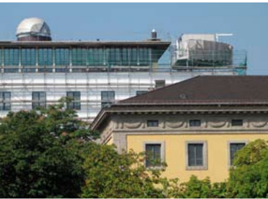
Fassadensanierung an der TU München