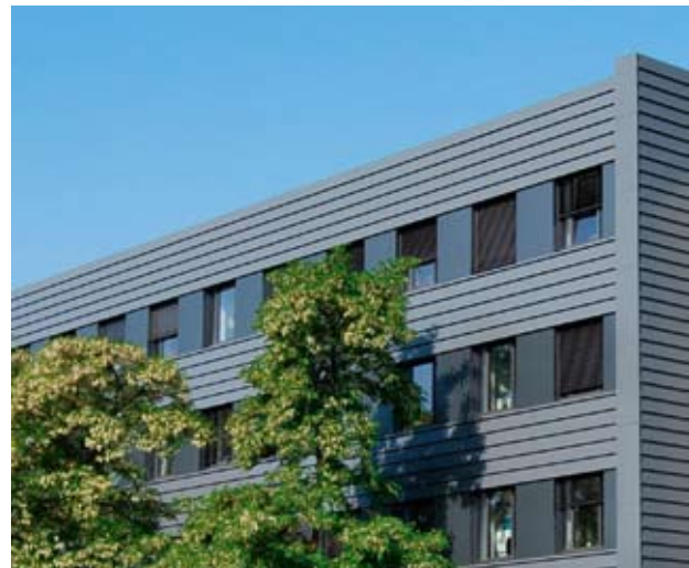
Gebäude unterschiedlicher Nutzungen werden saniert: links die Turnhalle am staatlichen Markgräfin Wilhelmine Gymnasium in Bayreuth; rechts das Institut für Virologie und Immunbiologie, Julius-Maximilians-Universität in Würzburg

den Anforderungen nicht gerecht wurde. Denn die Bearbeiter vor Ort fügten zum Teil neue Spalten mit für sie wichtigen Informationen ein oder löschten Spalten, die sie nicht benötigten. Das Zusammenführen der verschiedenen Versionen erwies sich deswegen als kompliziert, die Verwaltung unterschiedlicher Datenstände führte zu zusätzlichem Aufwand.