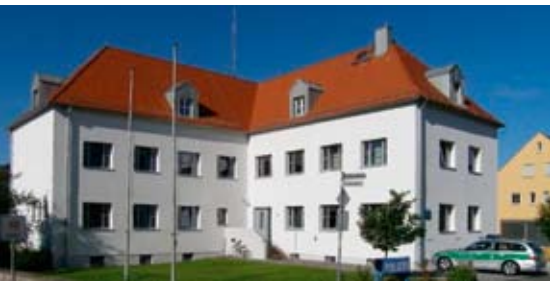
Auch im ländlichen Raum werden viele Maßnahmen gefördert wie die Verbesserung der Gebäudehülle der Polizeiinspektion Parsberg